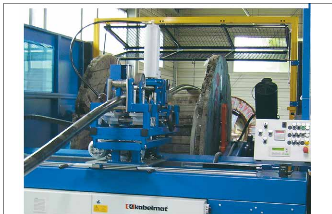
Abb. 2 MESSBOI 100 in einer UMROL eingebaut

Dieses Längenmessgerät besteht aus einem stabilen Grundkörper mit Führungsrollen an dem die Messeinrichtung angebaut wird. Die Messgutabtastung erfolgt mit einem Messrad.