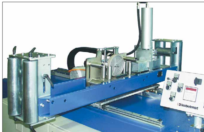
Abb. 2 MESSBOI 80 eingebaut in Maschine mit hydraulischem Abschneider und Rollenkäfigen

Dieses Längenmessgerät besteht aus einem stabilen Grundkörper mit Führungsrollen, an dem die Messeinrichtung angebaut wird. Die Messgutabtastung erfolgt mit einem Messrad.