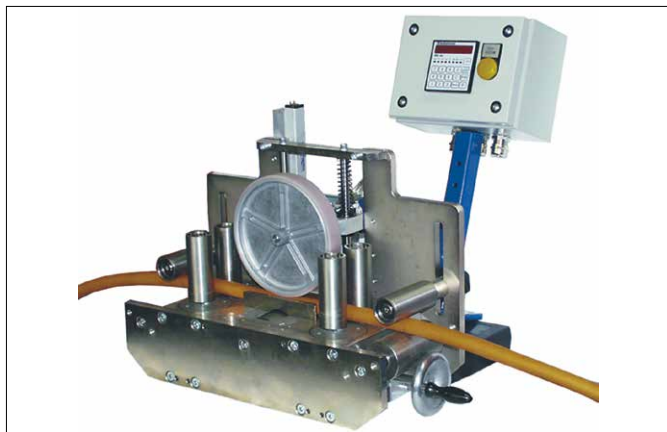
Abb. 1 MESSBOI 80 mit Gehäuse